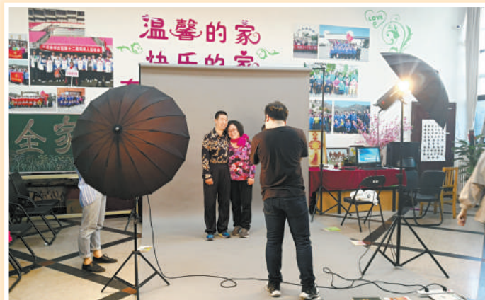
▲马家堡街道残联为辖区40余位残疾人家庭拍摄全家福。

奥运会、2010广州亚运会的赛会注册媒体；培养中国第一个视障高级速录师。2008年北京市总工会授予“奥运立功‘首都劳动奖章’”；2016年北京市残疾人联合会、市人力资源和社会保障局授予“北京市残疾人自强模范”的荣誉称号；2017年北京市民政局、市人力资源和社会保障局授予“2015—2017年度北京市社会组织系统先进个人荣誉称号”。