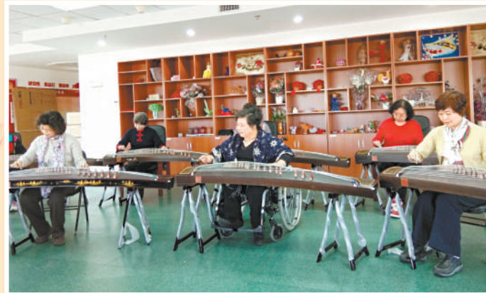
▲丰台区肢体残疾人协会举办古筝培训。