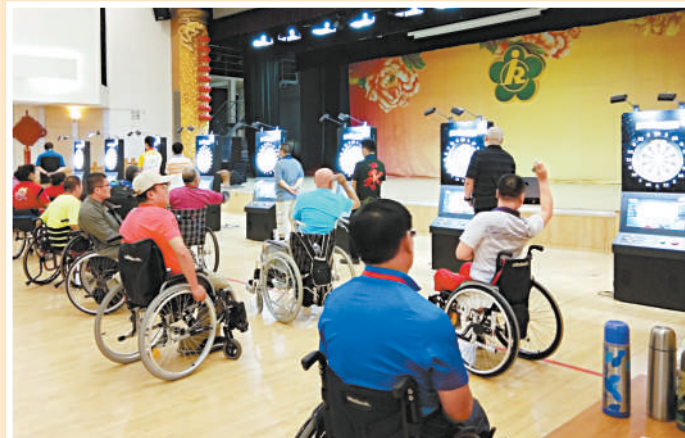
▲丰台区残疾人参加北京市第十届残疾人运动会飞镖赛。