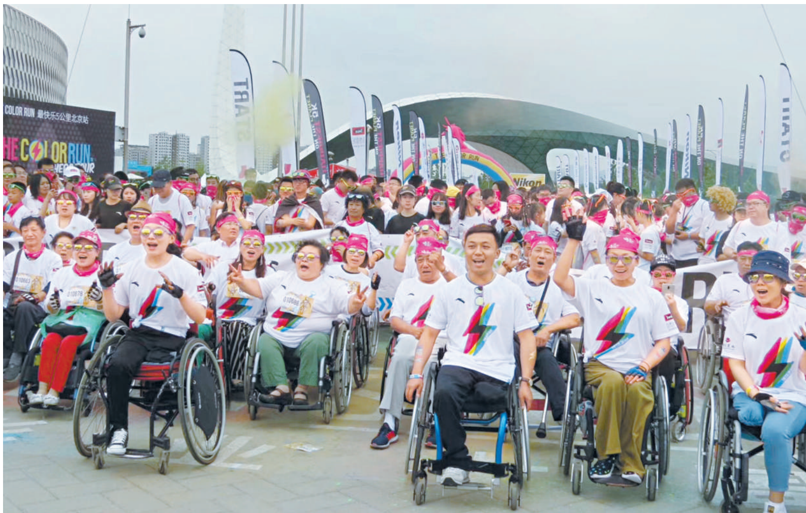
丰台区残疾人参加彩色跑活动。

精准居家无障碍环境。区残联坚持需求清、底数清、任务清的“三清”原则，经过细致的需求调查、考核施工单位，定计划、出方案，协调财政部门、确定施工单位和监理单位，狠抓无障碍政策宣传和入户勘测、施工验收、检查归档等关键环节，高质量地完成了556户残疾人家庭无障碍改造任务。