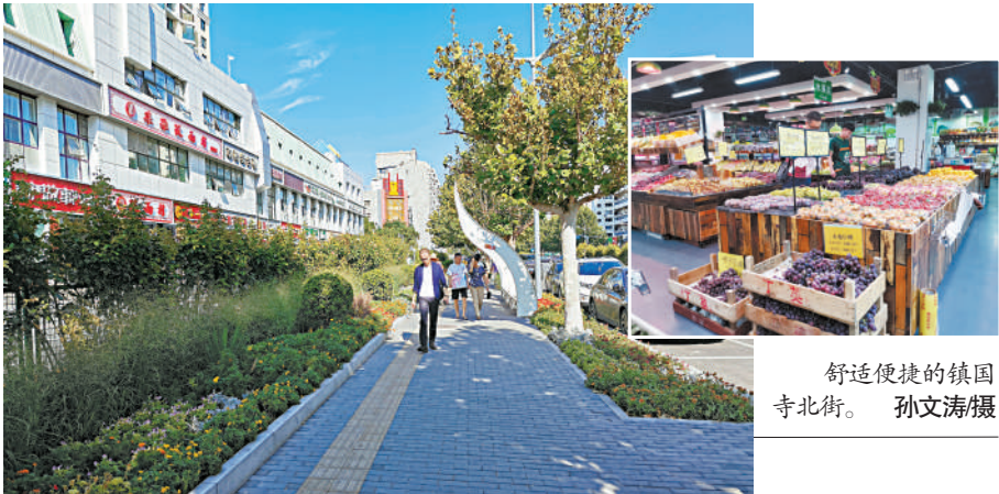
舒适便捷的镇国寺北街。

劳、眉州东坡、匹夫涮肉、西贝莜面村;教育培训品牌有ABC英语、LiLy英语;老字号有稻香村、张一元;网红品牌店有爸爸糖手工吐司、渝签儿de缸、一点点奶茶;便民超市及菜店果蔬类有志广邻里之家、京客隆、全时便利店等。