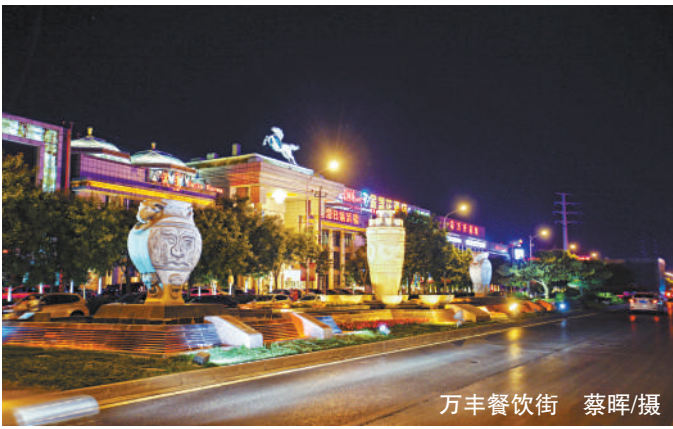
万丰餐饮街

夜美食广场将上演璀璨之约,点亮京城百姓消暑夏夜生活。狂欢非洲迎鼓鼓、泰国雨林大象嘉年华、“梦幻世界”环球歌舞荟萃、梦幻风情花车大巡游、亚洲风情小舞台、非洲嗨翻小剧场、欧洲魔幻漂秀秀场等活动精彩纷呈。日间演出与延时活动构成的11个乐享板块,千余场文化演艺、百余位中外演员、近50个国家经典歌舞节目将全天候、全时段、全景观、全方位轮番上演。来自乌干达、乌克兰、俄罗斯、古