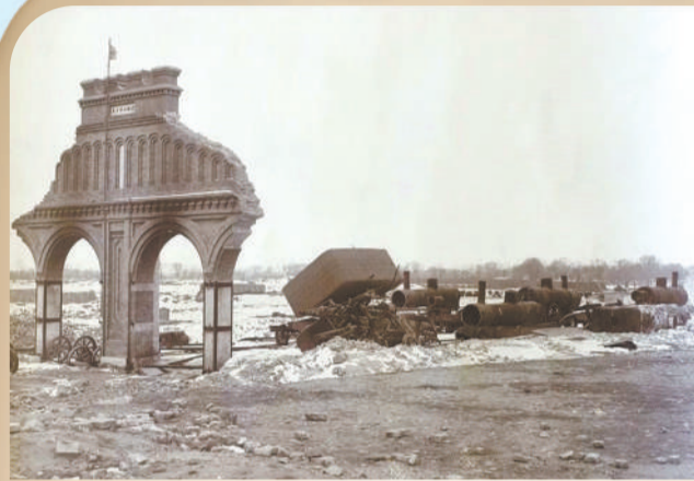
▲1897年,丰台机务段成立,用灰砖砌筑的矩形炼瓦式检修库建成。1900年,检修库被义和团破坏,只有东墙和匾额幸存。匾额上书写着此车房的建成年月“光绪二十三年”,此匾被蒸汽机车的黑烟熏成了黑色。