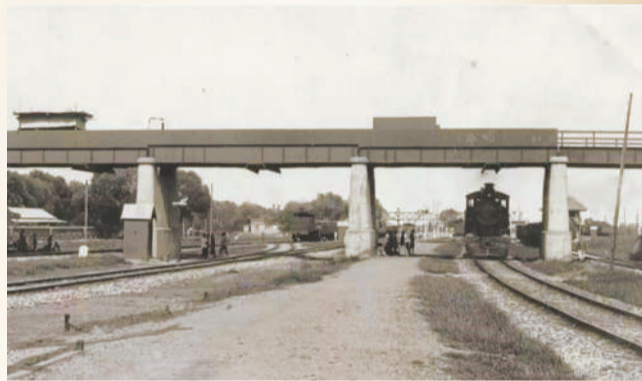
▲《辛丑条约》签订后,北京局势暂时平缓。丰台站这一重要的中转站也被重新修复,在20世纪初恢复运营。火车站的建成往往会改变一个地区的风貌。恢复运营后,丰台站的客流量达到日均300余人。这里货运也十分繁忙,车站每日货物发送量达七八百吨,促使货栈业和商业在丰台站附近大量兴起。民国初年,丰台站实际上已经成为连接京汉、京张和京奉这三条铁路干线的交通中樞,初具编组站的规模。