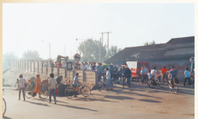
▲1988年,丰台大桥的重建工程启动。工程由两部分组成:一部分是四环路丰台铁路立交桥,桥长为83.3米,桥高7.55米,是当时全国最大的顶进式箱涵立交桥;另一部分是连接丰台车站前正阳大街的公路立交桥,桥长78.18米,桥宽为24.6米。经过两年的艰苦奋战,丰台大桥于1990年竣工通车。图为当时的代用桥。