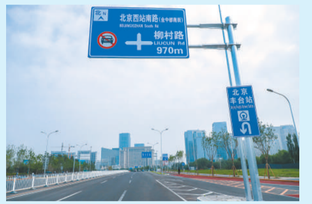
▲北京丰台站作为国内首座采用高铁、普铁双层车场重叠设计的特大型车站,形成了“顶层高铁、地面普铁、地下地铁”的立体交通模式,方便旅客“无缝”换乘城市轨道交通;建设了人性化、便捷的旅客服务系统和覆盖全站的无障碍设施,可提供售票、问询、公安制证、快速、重点旅客预约和急客临时改签等服务;采用光伏发电系统、自然照明系统、自然通风系统,可大幅节约建设投资和今后运营的能耗。同时,也带动了周边地区基础设施的建设,更好地服务丽泽金融商务区、丰台科技园,促进城南地区经济社会发展。左图为丰台科技园,右图为丽泽金融商务区。