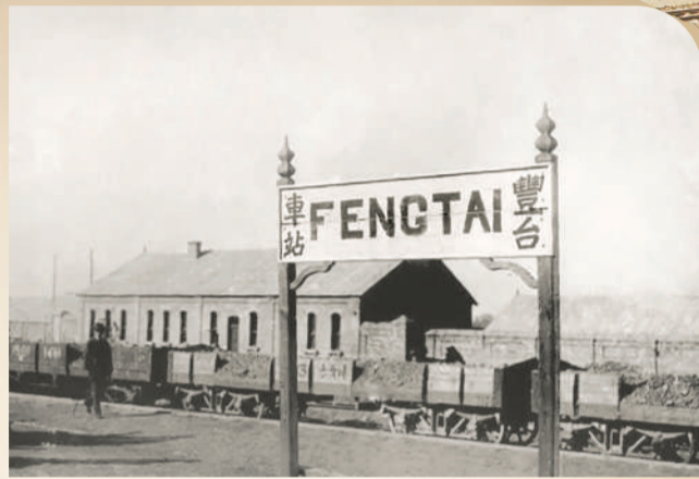
▲丰台车站建成初期的中英文站牌,后方为站舍。为使各国籍铁路工人均能看懂,当时货车的车号使用阿拉伯数字和中国传统数字——苏州码子,如站牌后方的敞车车号为793,即苏州码子“土父川”。