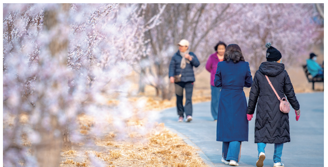
游客漫步南苑森林湿地公园。