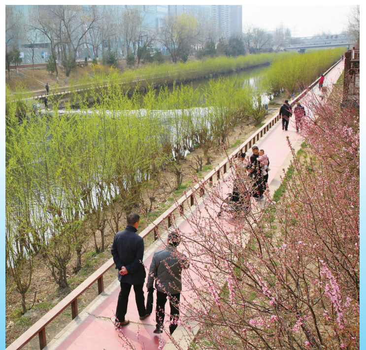
市民漫步在凉水河滨水步道。