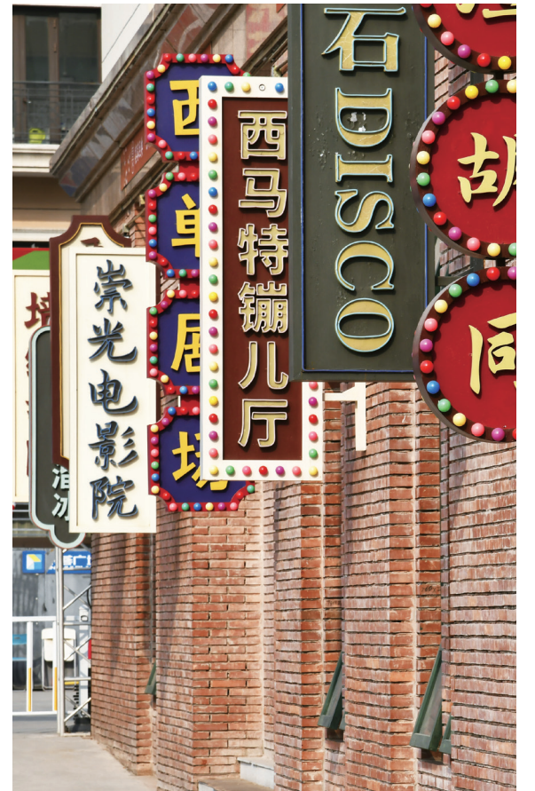
群落式儿童主题文化产业园区——京荟广场。