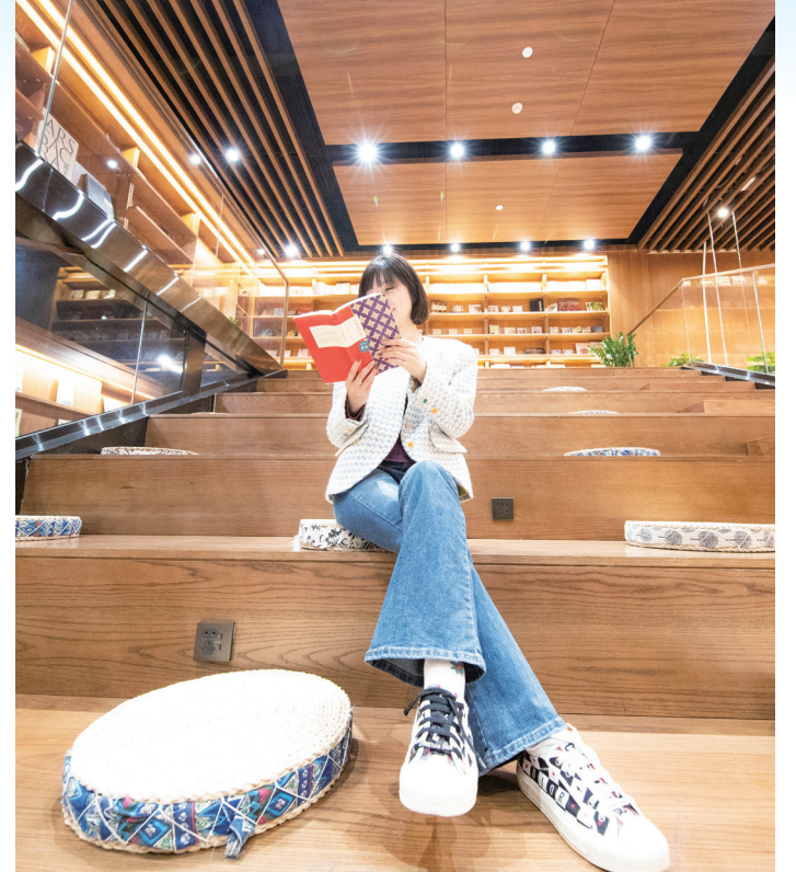
“书香”润丰台——泰舍书局。