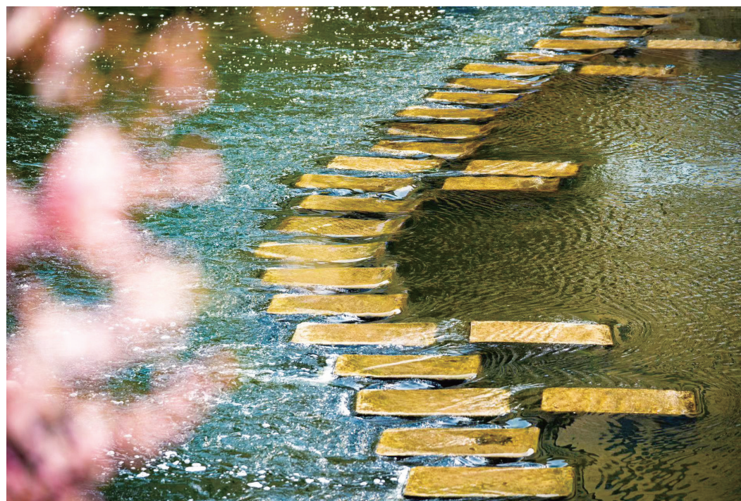
凉水河水草丰沛,成为承载公共活动的蓝绿空间。