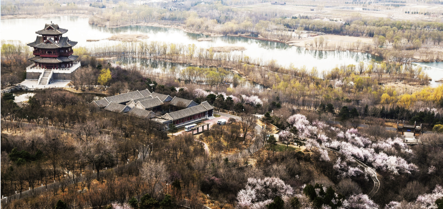
永定河绿色生态发展带明珠——北京园博园。