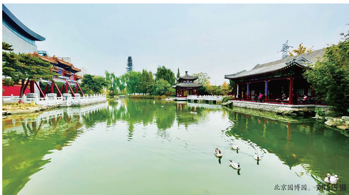
北京园博园。

如今的丰台, 居民望得见青山绿水, 闻得到鸟语花香, 留得住美丽乡愁。森林城市的创建造就了丰台区蓝绿相间的生态基底, 也打造了建设首都功能重要承载区、生态文明建设引领区的亮丽名片。森林绕城、绿道连城、碧水穿城、湿地润城、公园遍城、农田留城、花果香城、生物汇城、景观靓城的森林城市布局已然形成。