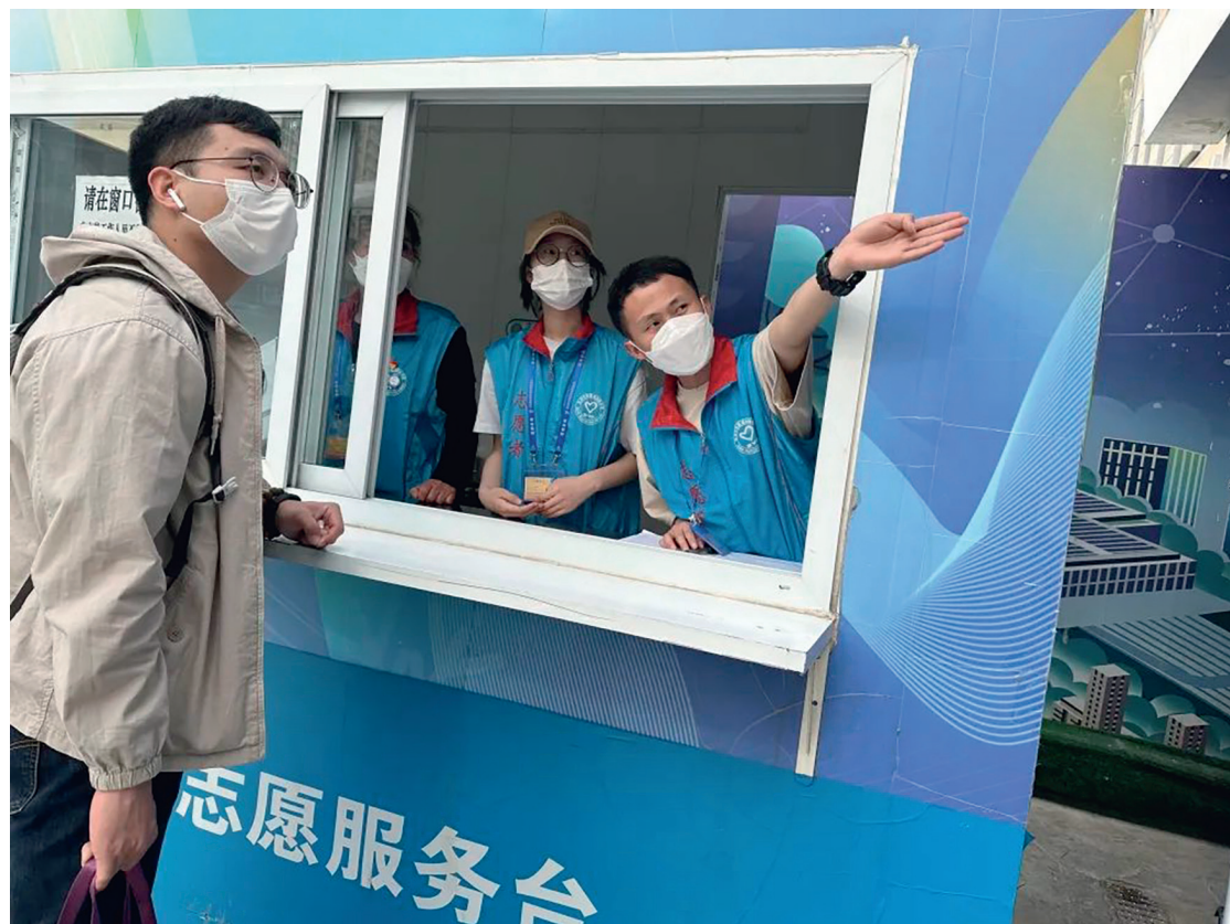
志愿者为过往旅客提供指路问询、行李搬运、助残引导等服务。

本报讯(特约记者 叶婉)“五一”假期,全国铁路创单日客流历史新高。北京丰台站假日运输期间预计发送旅客35.8万人,高峰日客流预计突破6.3万人,创开站以来新高。一群身穿蓝色马甲的大学生志愿