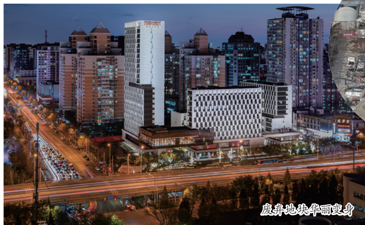
废弃地块华丽变身