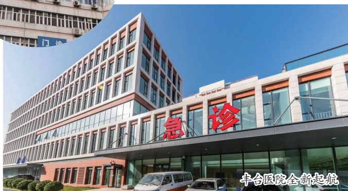
丰台医院全新起航

因建成年代不同,北京丰台医院原就医区未经整体规划,诊疗功能布局松散、空间不足,较为凌乱。