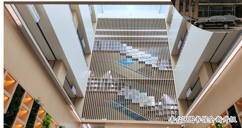
丰台区图书馆全新升级

丰台区图书馆创办于1978年,1989年迁入丰台文化中心大楼,是不少丰台人心中的城市记忆。