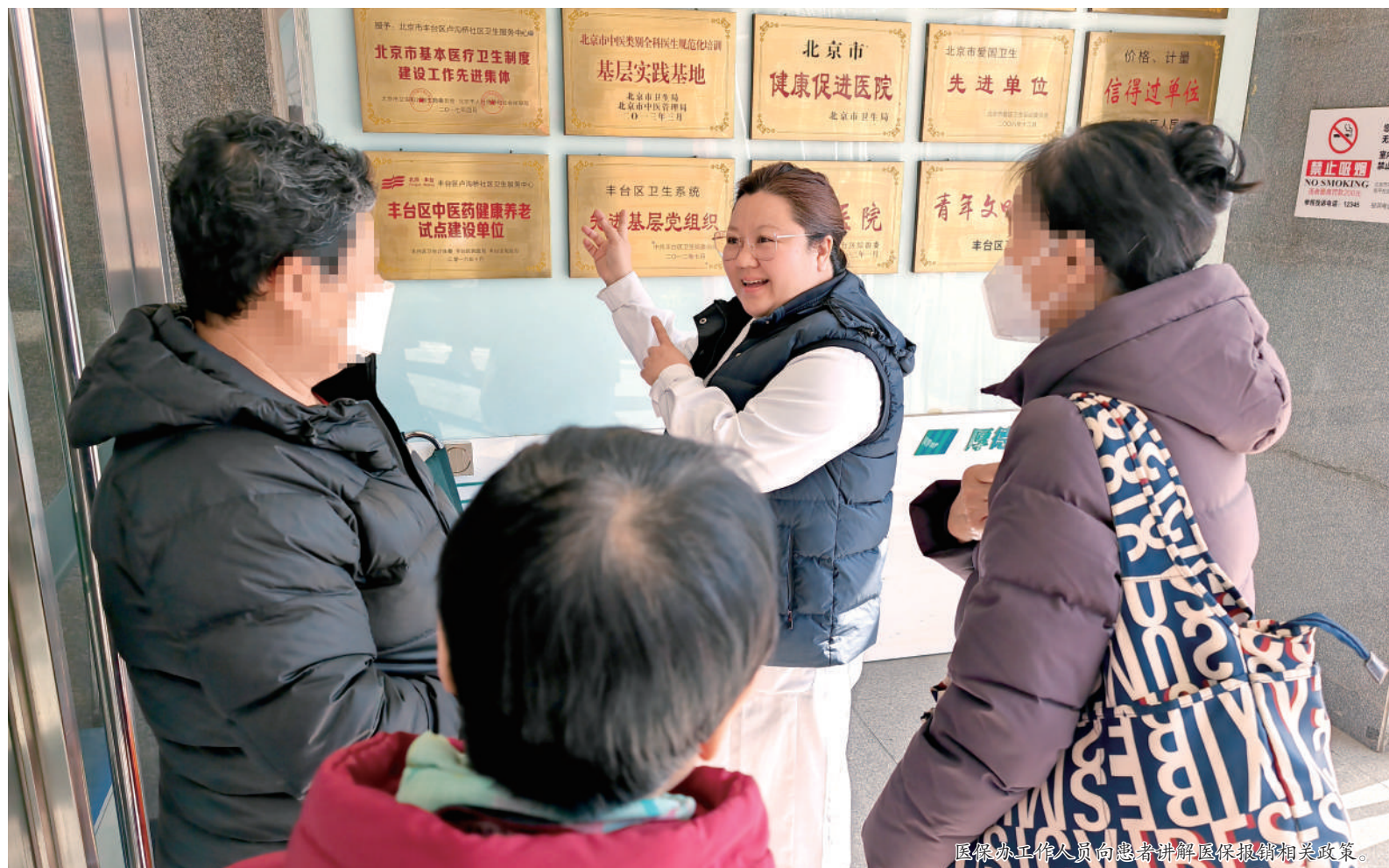
医保办工作人员向患者讲解医保报销相关政策。

本报讯(通讯员 梁立梅 王雪丽 范文雪 钱瑞)窗口是患者与医院交互的第一道“窗口”,更是服务患者最近的“入口”。做好窗口服务,细心解答好每一个来窗口患者的疑问,是宛平社区卫生服务中心全体职工孜孜以求的目标。