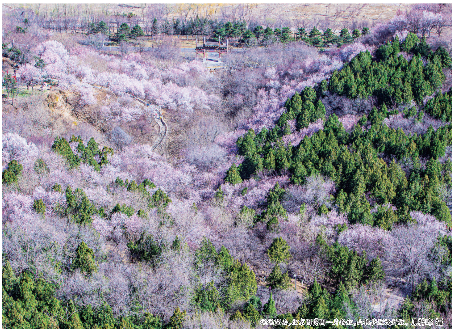
远远望去,北京园博园一片粉红,山桃花烂漫开放。

本报讯(记者 林瑶 原梓峰)“山色桃花柳上开,芳香不许人自来”。3月20日,记者来到位于丰台区的北京园博园,随着春季气温逐渐上升,樱花、海棠、丁香、牡丹等几十种春花次第开放,北京园博园进入了最佳赏花园季。