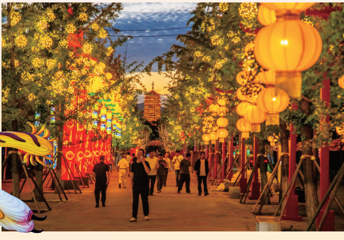
▲星光大道般的主路不仅被各色彩灯覆盖,还与远山亮灯的永定塔相框遥望。