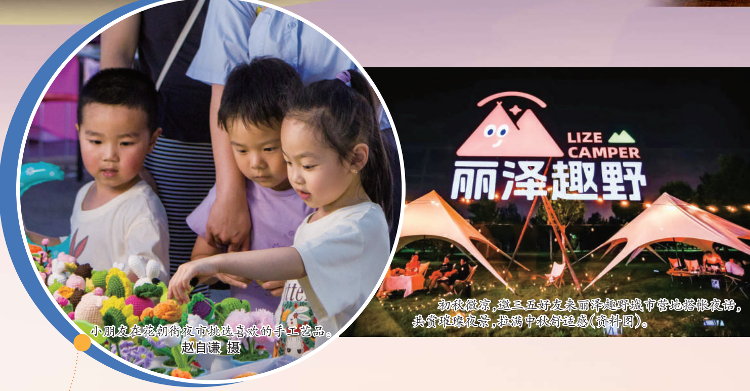
小朋友在花园夜市挑选喜欢的手工艺品。