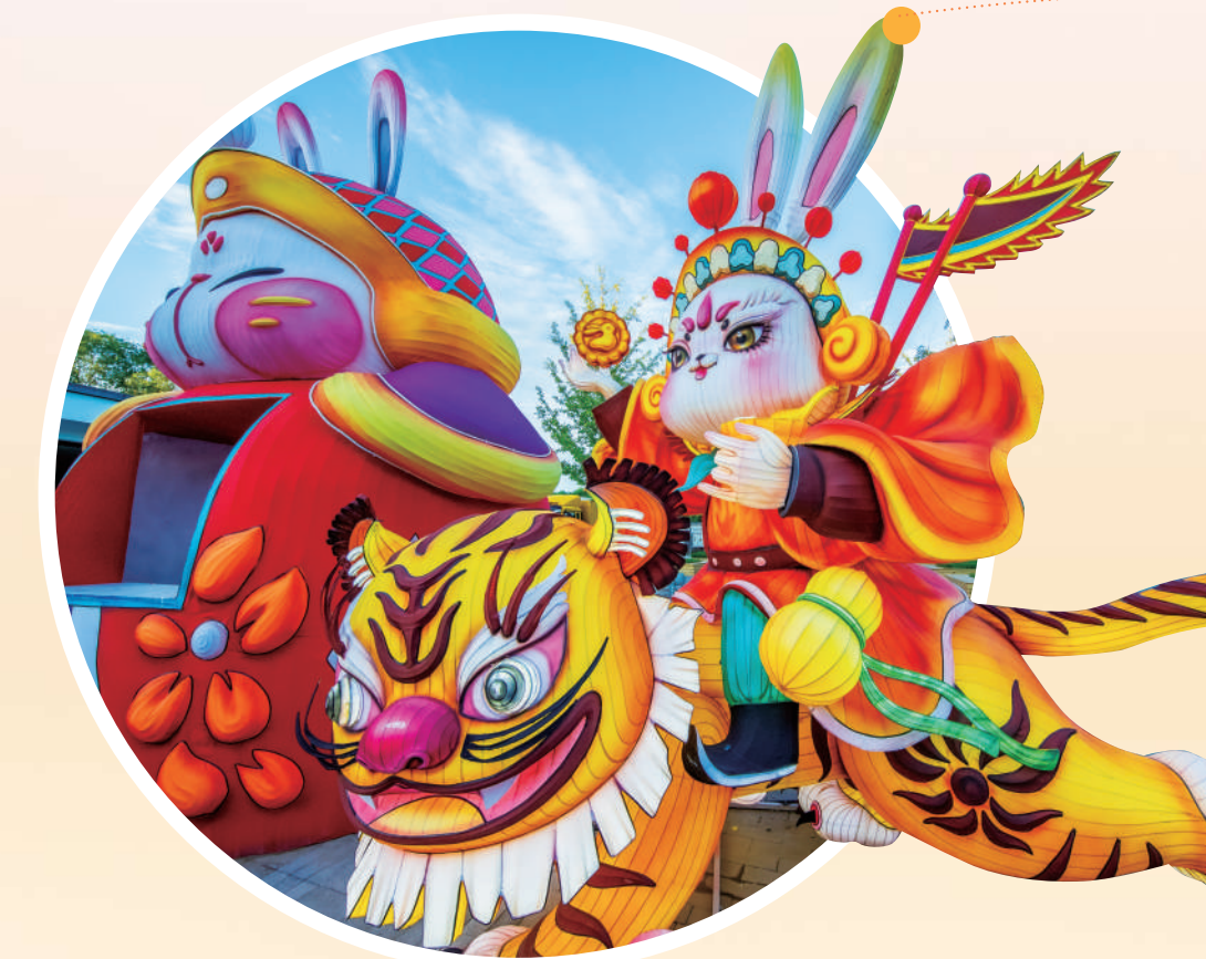
▲兔爷彩灯京味十足。