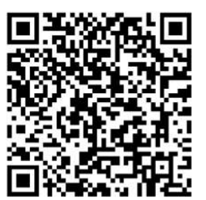
(扫描二维码,查看“京彩灯会”最全交通指南)

“丰台老店”。特色街区主要指万丰路餐饮街,靛厂路餐饮街,丽泽商务区,科技园区,云岗、王佐餐饮街区,园博园餐饮区,方庄餐饮街,以及樊羊路餐饮街区等八大街区。在这些特色街区,既能吃到便宜坊焖炉烤鸭、老门框爆肚涮肉等京城特色美食,也能品尝到湘菜、川菜、鲁菜等全国美味。 按照北京市关于“京彩灯会”活动的部署要求,丰台区还成立了区服务保障工作领导小组,修缮提升了园区1000余处基础设施,3.4万米的电路设施改造、新增近800处各类游客服务设施、新建应急广播系统等。为了保障游客的观赏体验,在交通、停车、导览等方面也做了精心安排,开设交通专线、摆渡车,并扩建停车位等。市民可通过“京彩灯会”官方公众号、抖音、支付宝、美团、携程平台搜索“京彩灯会”线上购票,也可在北京园博园3号门票处线下购票。