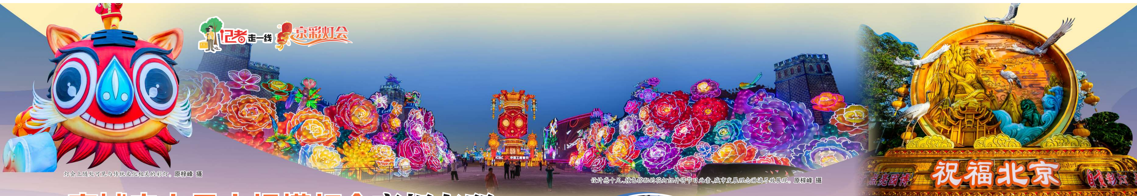
灯会上随处可见与传统文化相关的彩灯。