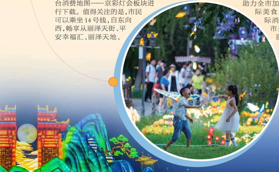
▲五彩斑斓、变幻莫测的光影在夜幕下熠熠生辉,踏入紫谷伊甸园,犹如进入爱丽丝梦幻仙境。