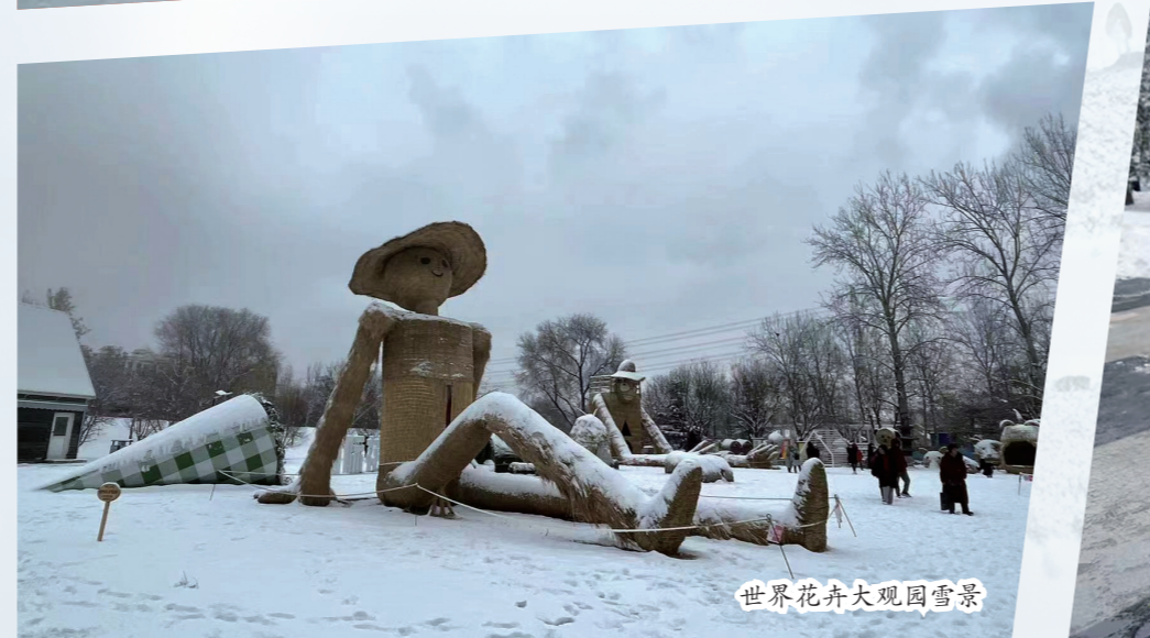
世界花卉大观园雪景