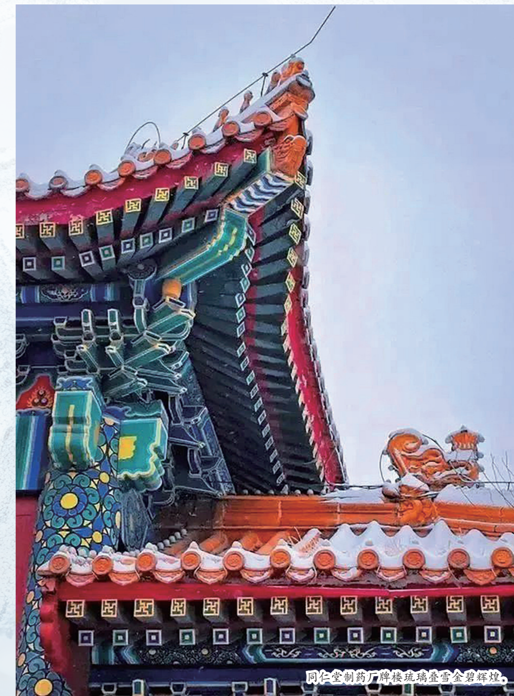
同仁堂制药厂牌楼琉璃金雪景辉映