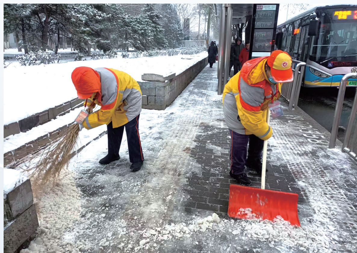
丰台区近900名公共文明引导员清扫路面积雪