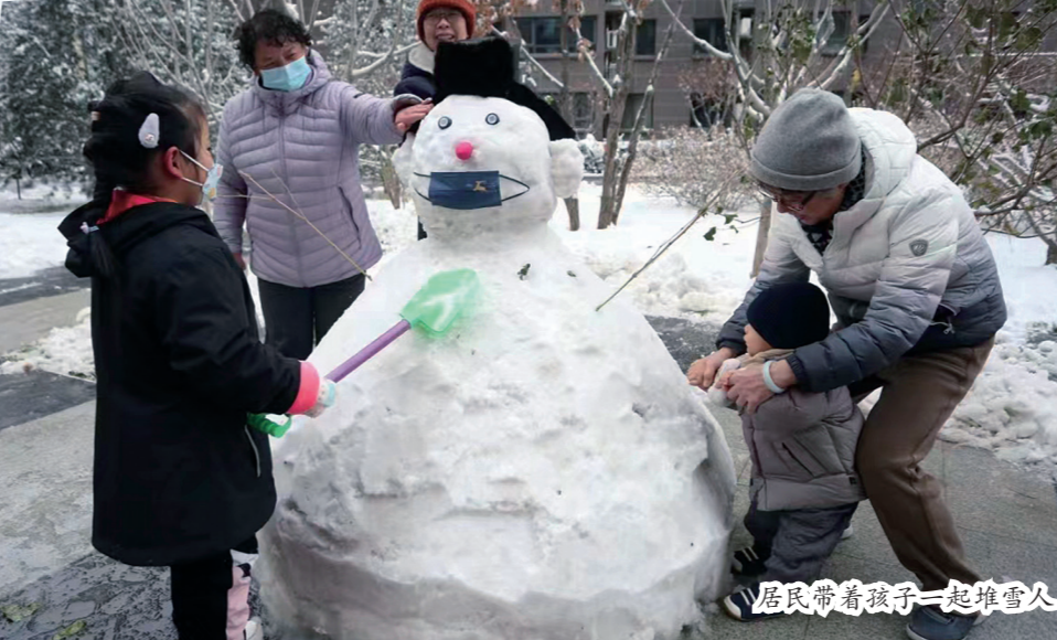
居民带着孩子一起堆雪人