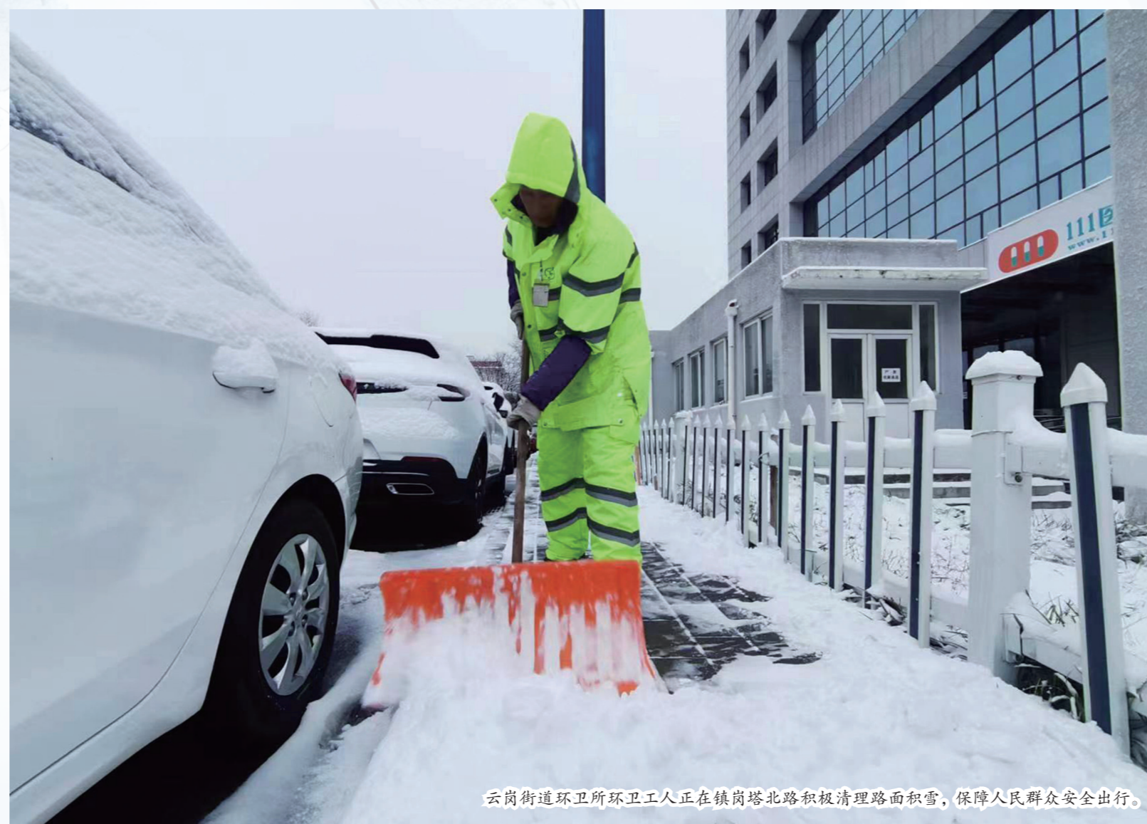
云岗街道环卫所环卫工人正在镇岗塔北路积极清理路面积雪, 保障人民群众安全出行。