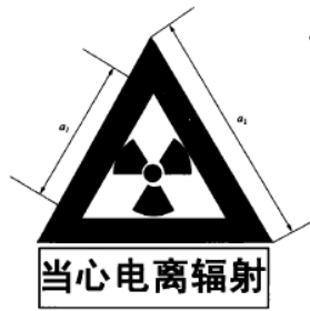
图 F2 电离辐射警告标志

电离辐射的警告标志如图 F2 所示。警告标志的含义是使人们注意可能发生的危险。其背景为黄色，正三角形边框及电离辐射标志图形均为黑色，“当心电离辐射”用黑色粗等线体字。正三角形外边 a_1=0.034L ，内边 a_2=0.700a_1 ， L 为观察距离。