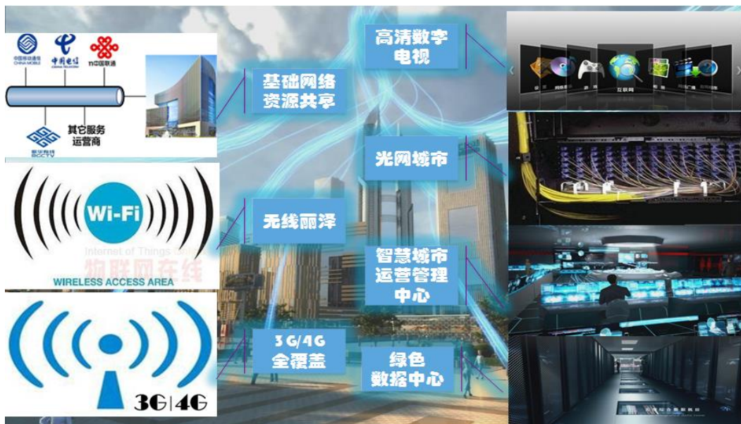
北京丽泽金融商务区网络基础设施建设

实施“宽带丽泽”计划，率先实现光纤和卫星双路通信模式，为金融企业提供即时通讯保障；着力打通信息基础设施建设“最后一公里”，光纤将直接接入办公桌，为智慧城市建设提供基础支撑。引进先进的信息技术，积极发展三网融合技术及其相关应用，实现区域网络资源的共享；积极发展下一代移动通信（4G）技术、物联网技术等，增强城市运行、城市风险源、城市公共安全等监测系统的建设，提高政府应急指挥和领导决策中的效率；建设大规模金融大数据中心，有效降低企业内部管理及服务成本，为探索互联网金融和离岸金融奠定坚实基础。