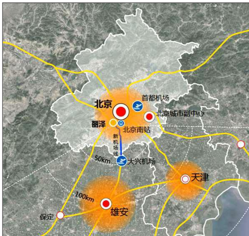
丽泽金融商务区交通区位示意图

丽泽金融商务区是北京市紧邻二环的最后一块成规模集中建设区，直线距离金融街 6 公里、北京商务中心区 12 公里、北京城市副中心 28 公里、北京大兴国际机场 37 公里、雄安新区 102 公里，是京津冀协同发展战略中连接“一核”“两翼”的核心腹地。