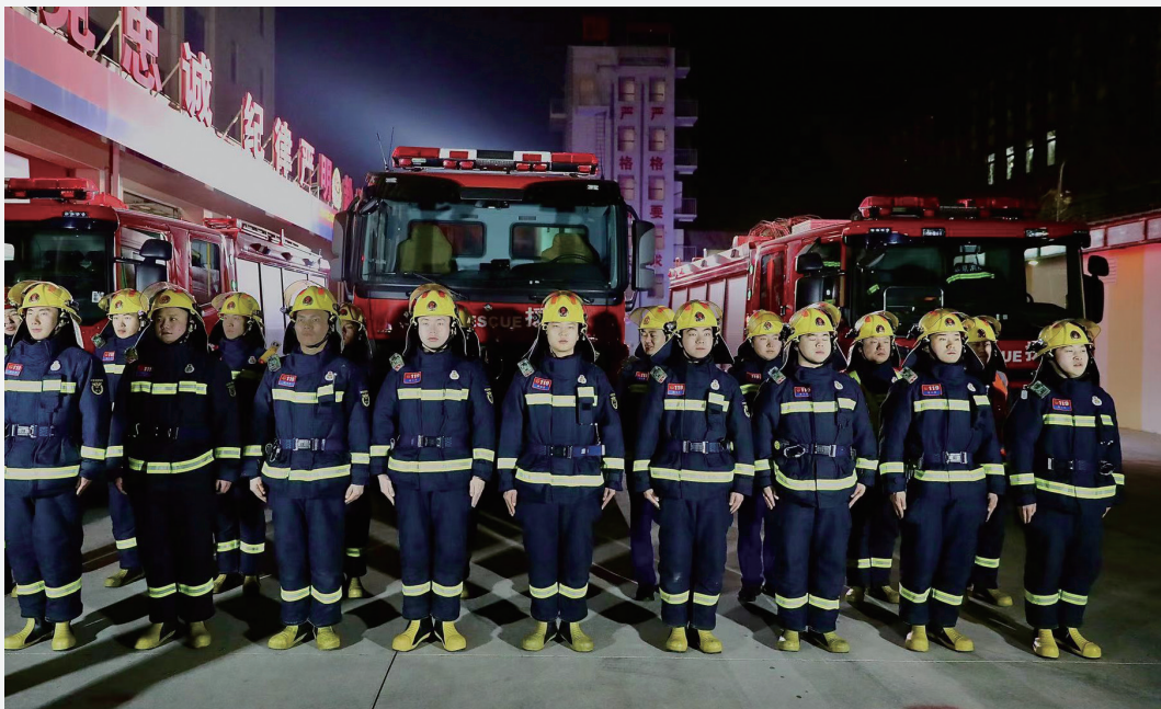
除夕当天,区消防支队马家堡特勤站指战员整装待发,默默守护城市安全。