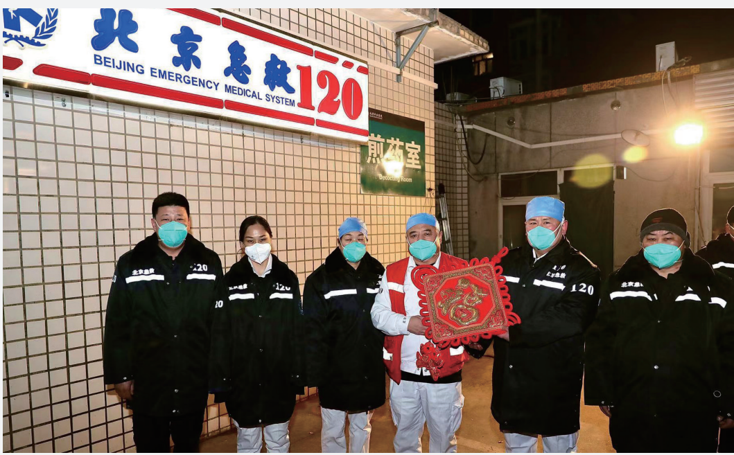
北京急救中心丰台分中心医护人员集合待命,守护市民健康。