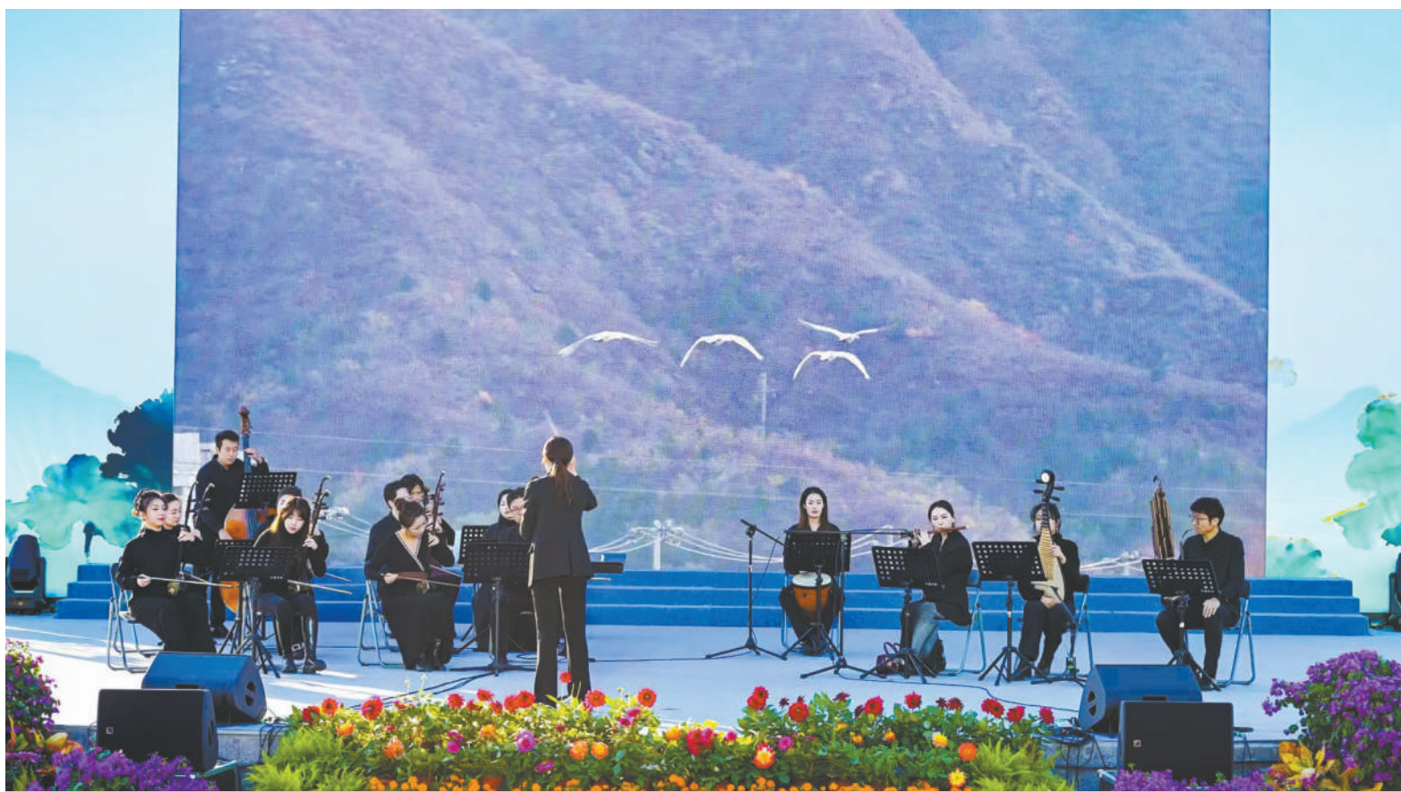
11月2日,由北京市园林绿化局联合北京广播电视台总台、中国音乐学院、丰台区人民政府等单位共同举办的“京华羽翔·2025北京森林百鸟音乐会”在丰台区莲花池公园奏响。音乐会以器乐演奏、歌曲演唱、口技、舞蹈等多元艺术形式展现着鸟之美、鸟之韵、鸟之趣、鸟之情。(详见03版)