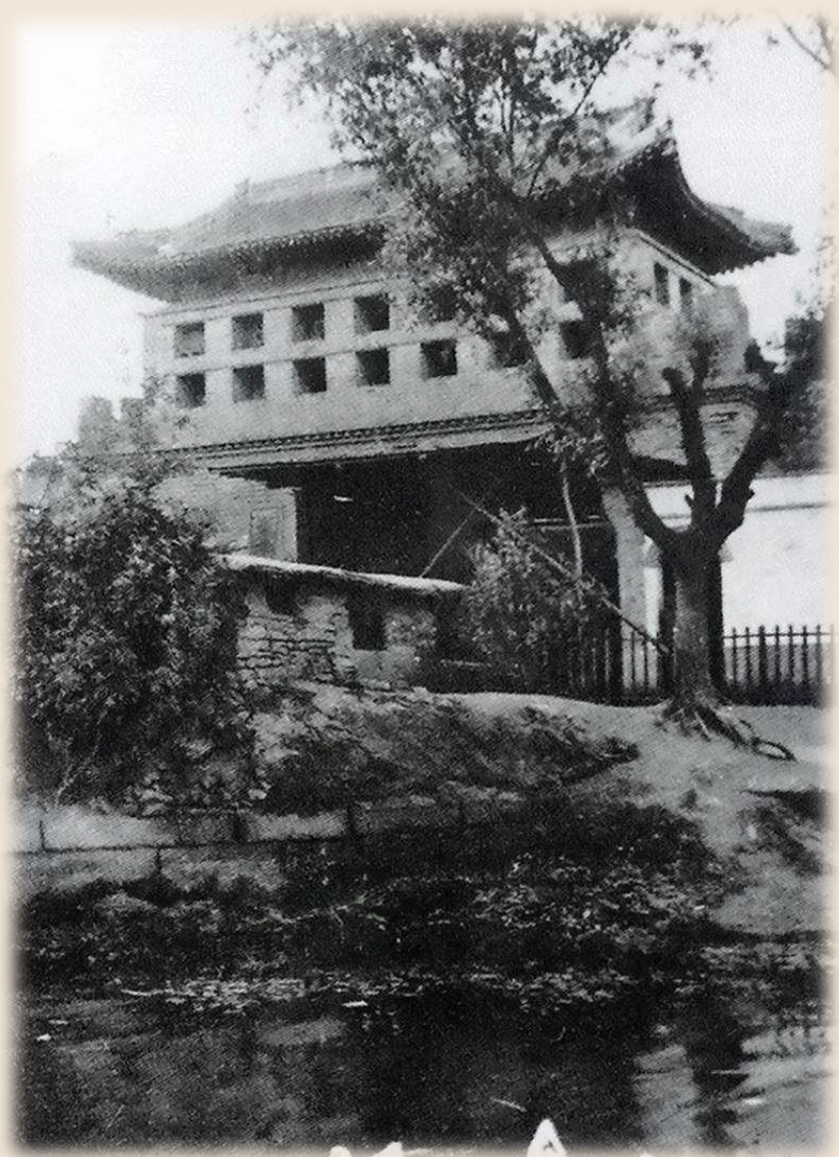
明朝时期,在这片土地上修建了一座右安门