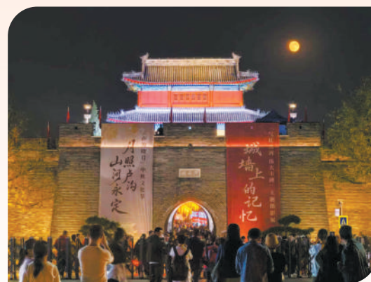
《宛平中秋夜》宋沈阳