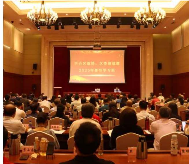
区政协、区委统战部举办2025年暑期学习班。