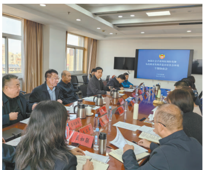
区政协召开“加强社会矛盾纠纷预防化解,为高质量发展营造良好社会环境”专题协商会。