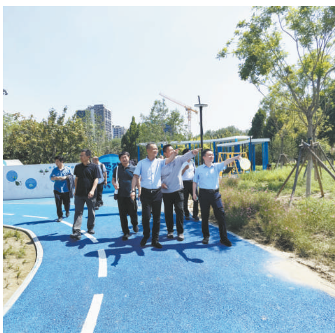
区政协常委、委员视察乐学公园。