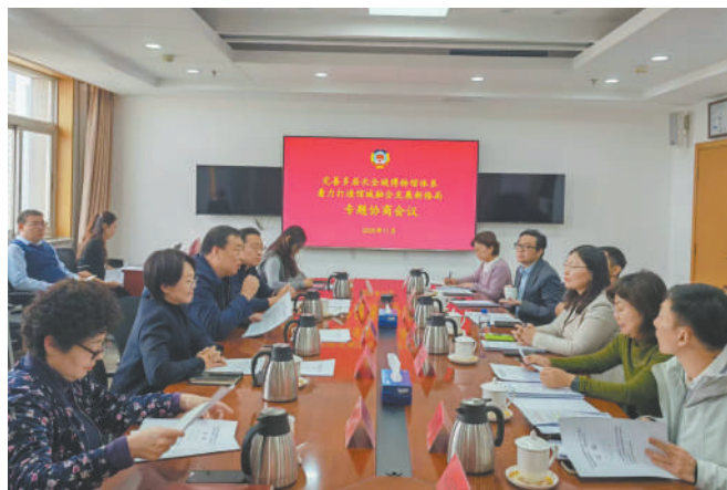
区政协召开“完善多层次全域博物馆体系,着力打造馆城融合发展新格局”专题协商会。