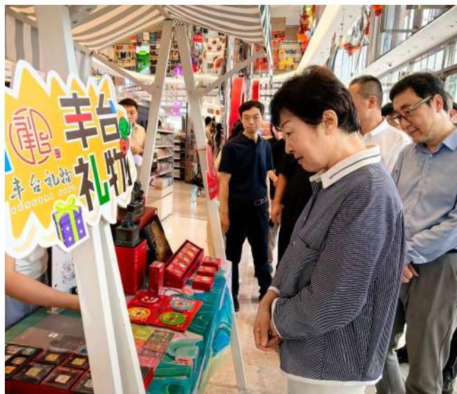
区政协开展“健全以街区为单元城市更新机制,系统重塑城市形态”议题专题调研。