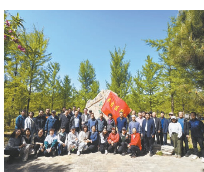
区政协开展民族团练林养护活动。