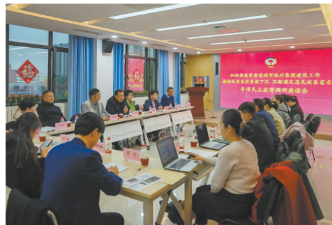
区政协围绕“加快推进紧密型城市医疗集团建设工作,推动优质医疗资源下沉,不断满足居民就医需求”开展专项民主监督调研。