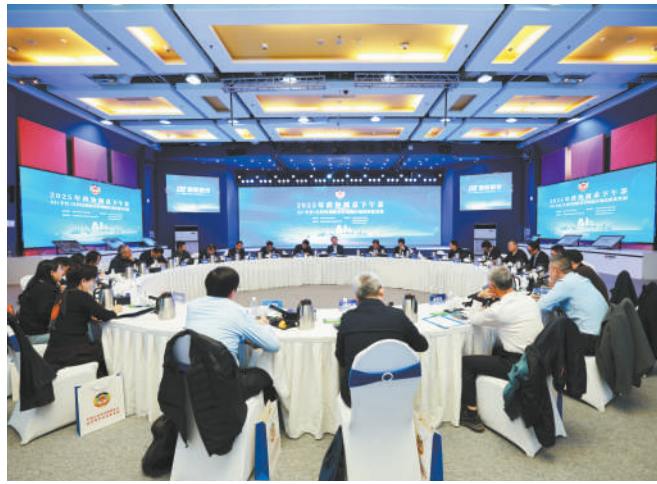
区政协举办“AI+丰台:让科技创新更好赋能区域高质量发展”圆桌下午茶活动。