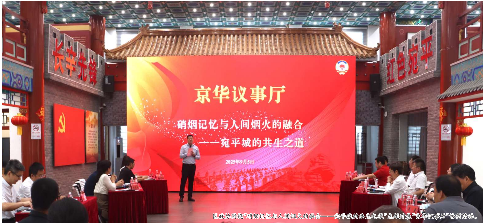
区政协围绕“硝烟记忆与人间烟火的融合——宛平城的共生之道”主题开展“京华议事厅”协商活动。

各项专题协商推动重点领域工作深入开展。常委会聚焦河西地区中长期发展规划编制,就打造“科技绿谷、山水新城”,推进产城融合高质量发展调研协商,提出强化产业培育,加快城市发展,加强文化赋能,推进生态建设,加强政府统筹5个方面20条意见建议,助力河西“生态科技新城组