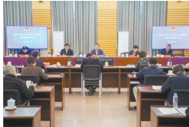
区政协召开“健全以街区为单元城市更新机制,系统重塑城市形态”议政会。

按照“懂政协、会协商、善议政,守纪律、讲规矩、重品行”的重要要求,健全委员教育、服务、管理、激励常态化长效机制,全面落实“五个一”委员履职要求,深入开展“服务为民”活动,宣传表扬成绩突出委员。进一步发挥专委会基础性作用,坚持和完善专委会领衔重点调研课题、专委会向常委会报告工作等制度,丰富拓展适合各专委会工作特点的履职平台,持续打造“一委一品”工作品牌。推进界别工作规范高效运行,促进不同界别委员联合联动、协同履职、优势互补。深化政治机关、模范机关建设,树牢“过紧日子”思想,大力提振忠诚干净、务实担当、勇于创新、团结干、廉洁干净的精神,努力把政协建成委员之家、民主之家、团结之家。认真总结本届政协五年履职情况,全面客观公正做好委员综合评价,扎实做好政协换届相关工作。