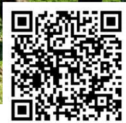
(详情请扫描二维码)