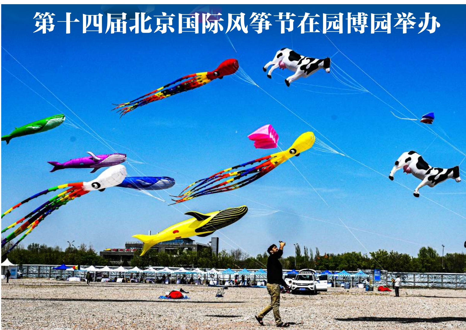
腾空的可爱“熊猫”、翻转的串形“奶牛”、摇曳的彩色巨型“章鱼”……4月11日至12日,第十四届北京国际风筝节暨第五届中国风筝锦标赛在北京园博园举办,来自国内外的15支风筝代表队同台竞技,在40000平方米的专业赛场中展开龙类中型、硬翅串类等8大竞赛项目的“长空角逐”,风筝爱好者们在开阔的场地上奔跑、牵线、仰望,亲身体验“忙趁东风放纸鸢”的春日乐趣。文/姜欢(详见08版)