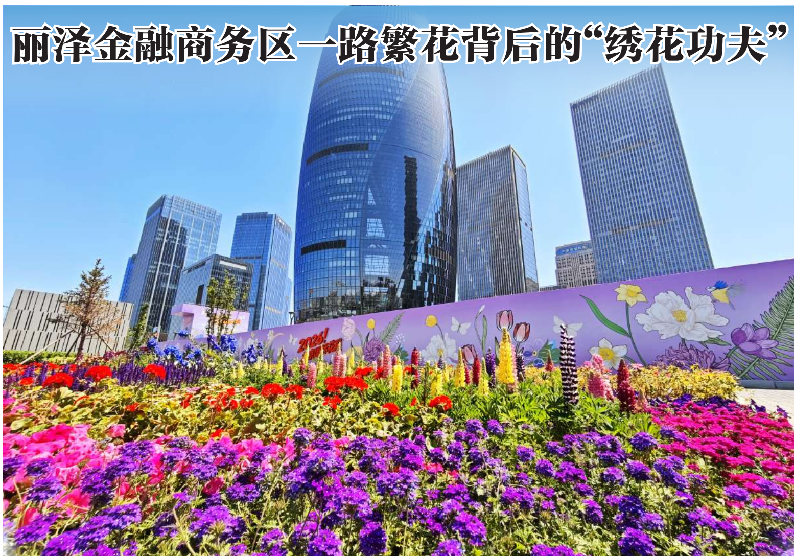
近日,记者探访花展保障一线,记录他们如何将一面灰墙“画”成风景,在2公里干道上“绣”出匠心,更从丽泽金融商务区里“挤”出五百个临时车位。 (详见03版)

5月1日至5日,日间步行街全域免费开放。东西双主题市集沿街道两侧排开,超80个特色摊位将古城变为缤纷的假日休闲空间。5月1日至3日每日17时30分至午夜,“宛平多巴胺夜”五大体验轮番登场。八段锦、瑜伽修习者身影与古建剪影相融,传统养生悄然复苏;暮色律动工坊里,非洲舞、曼波舞轮番登场,零基础也能尽情摇摆。20时,墙角夜市准时开市,夜市大富翁、0元起拍卖会等玩法让深夜市集惊喜不断…… (下转06版)