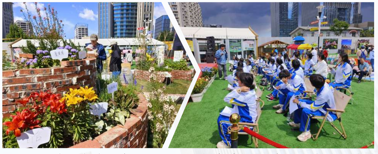
5月3日,北京国际花展丰台乐学公园课程展区内外处处洋溢着欢声笑语,从财商初现的儿童跳蚤市场到干货满满的解压沙龙,从有趣实用的中医药文化科普到互动十足的乐学体验,大人与孩子在这里共享假期时光,解锁多元欢乐体验。 (丰台区教委供稿供图)