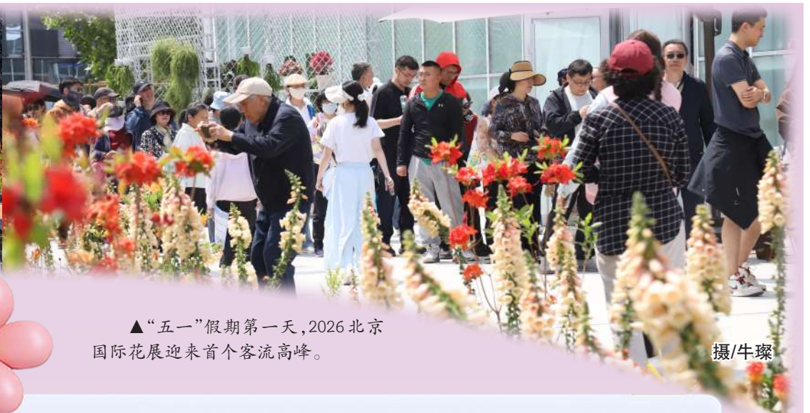
▲“五一”假期第一天,2026北京国际花展迎来首个客流高峰。