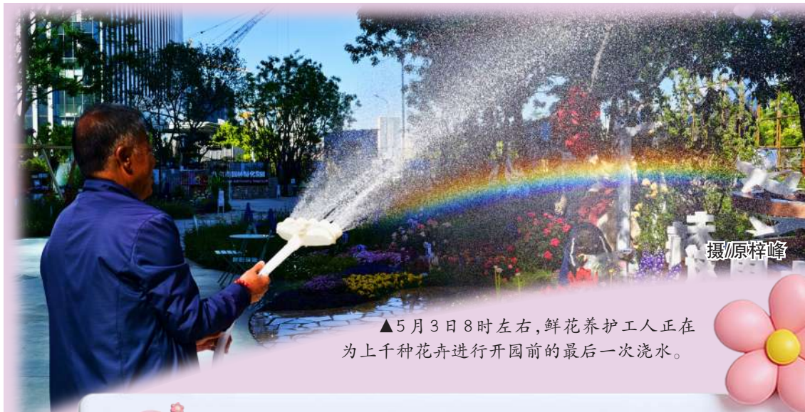
▲5月3日8时左右,鲜花养护工人正在为上千种花卉进行开园前的最后一次浇水。