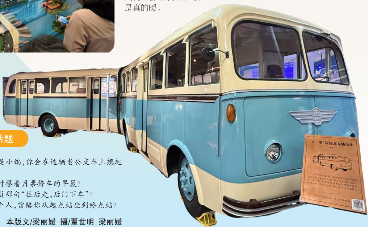
本版文/梁丽媛 摄/覃世明 梁丽媛 策划/《丰台时报》编辑部