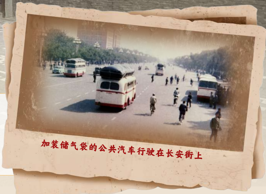
加装储气袋的公共汽车行驶在长安街上

5月18日是国际博物馆日,本报探店专栏“寻味丰台”带您开启博物馆之旅。 在丰台区莲花池西里,有一座看得见、摸得着、能体验的“流动城市记忆馆”——北京公交馆,以5000平方米展陈空间、“一五六八”特色展陈体系,全景呈现北京公交百年发展历程。没有距离感,全是烟火气,它更像老北京公交人的“老家”,一进门就回到几十年前的街头。