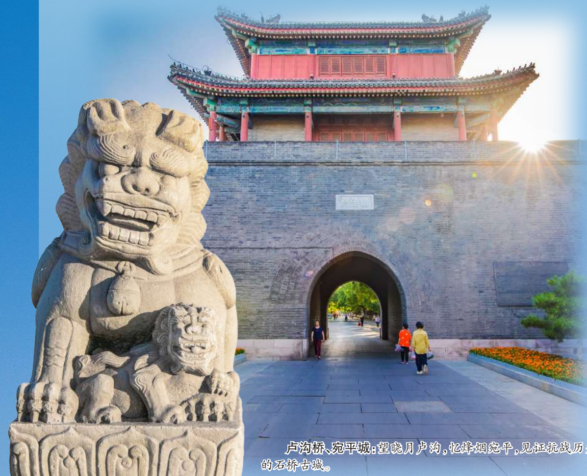
卢沟桥、宛平城:望晓月卢沟,忆烽火宛平,见证抗战历史的石狮子。