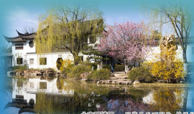
北京史家胡同:一园览尽天下园林,博物馆中赏四季,求索脚下观古今。