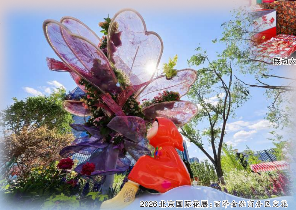
2026北京国际花展:雨泽金融商务区赏花海,12万平方米千种奇花,逛展购物遛娃一条龙。