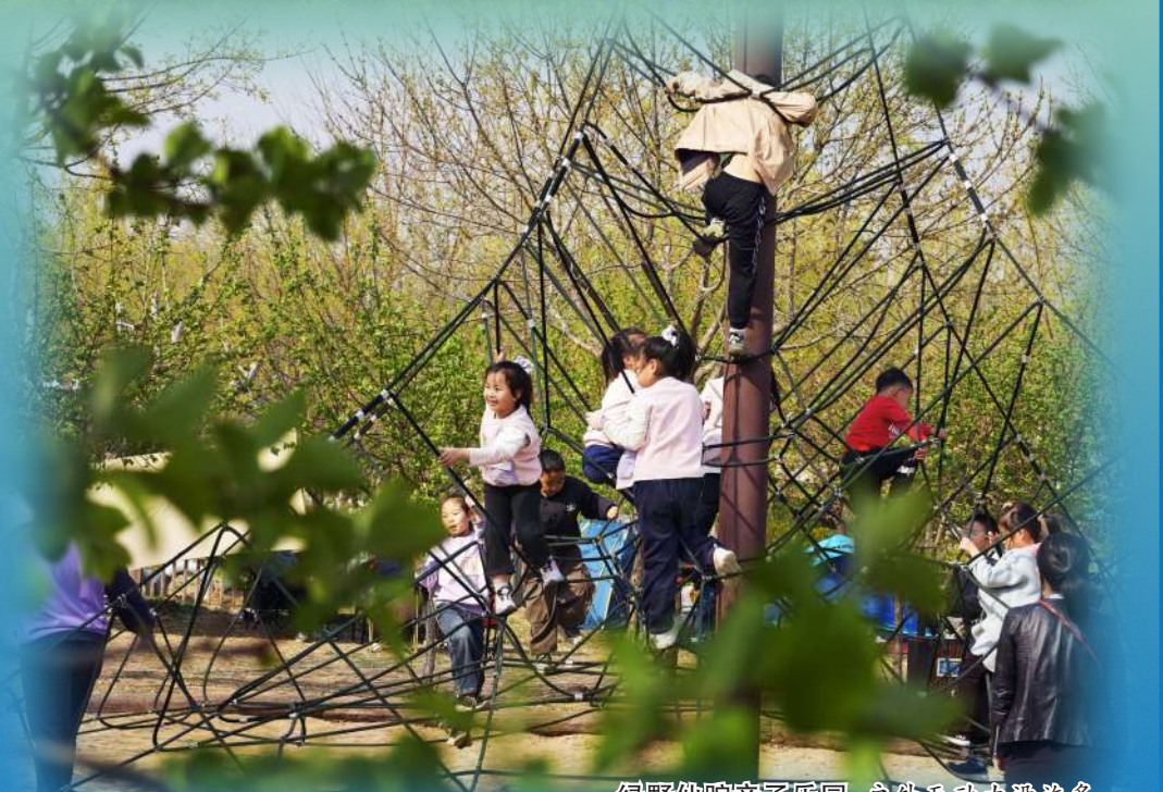
绿野仙踪亲子乐园:户外互动设施多,萌宠萌宠玩嗨,适合亲子放电。