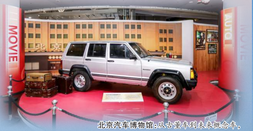
北京汽车博物馆:从古董车到未来概念车,男孩女孩都爱逛,能看能玩长知识。