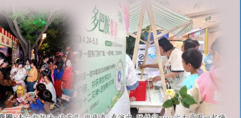
联动六大商圈:丰台新玩法:逛首店、逛夜市、看演出、逛展览……六大商圈一起嗨。