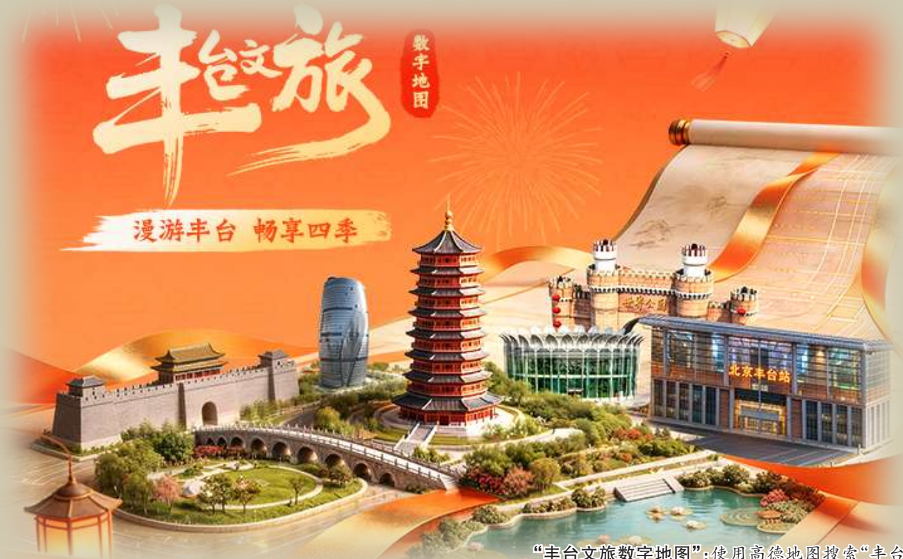
“丰台文旅数字地图”:使用高德地图搜索“丰台文旅”,可体验“丰台文旅数字地图”,AI定制专属路线。

当“数智”遇见“古都”,当“科技”碰撞“文化”,丰台正以全新姿态亮相。丰台区数智文旅生态大会上,124项数智文旅机会清单重磅发布,6位文旅局长集体“变身”数字人推介官。值此之际,我们以全新视角,将丰台文旅资源按“古今维度”重新分类,带您一图读懂这座首都西南部数智文旅新高地。