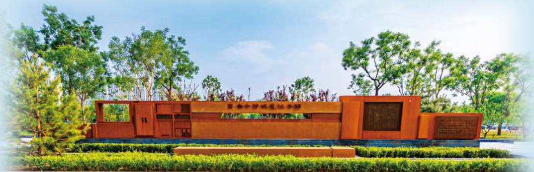
金中都城遗址公园:漫步城墙遗址,眺望金代故都,城市中的历史绿廊。

这一板块承载着北京870余年建都史的根与魂,是读懂丰台、读懂北京的“文化底片”。