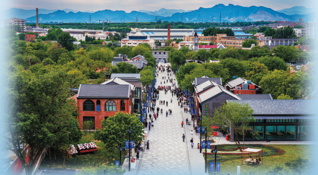
长辛店古镇:寻迹千年古镇,重温“二七”风云,探访“北方的红星”。