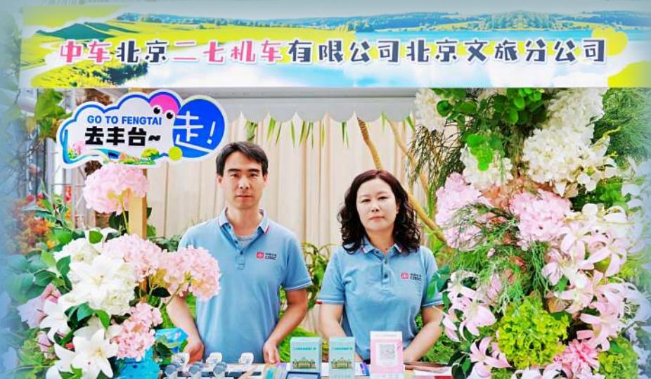
研学路线:一系列文旅项目目的地。其中,中车北京二七机车有限公司推出“解码工业——从匠心到创新”主题工业游,旨在打造集红色文化、工业底蕴与科技研学于一体的旅游线路及研学课程。