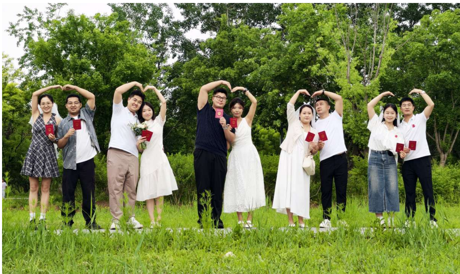
5月20日,丰台聚焦群众高品质婚姻服务需求,打造双场景特色颁证活动,在“丽泽天空之镜”观景平台、南苑森林湿地公园推出婚姻服务,以云端天际、森林绿意浪漫新场景,融合花卉美学、自然生态与文明婚俗理念,为新人们打造沉浸式、多元化、有温度的颁证、颁证体验。文/记者 袁阳 姜欢(详见06—07版)