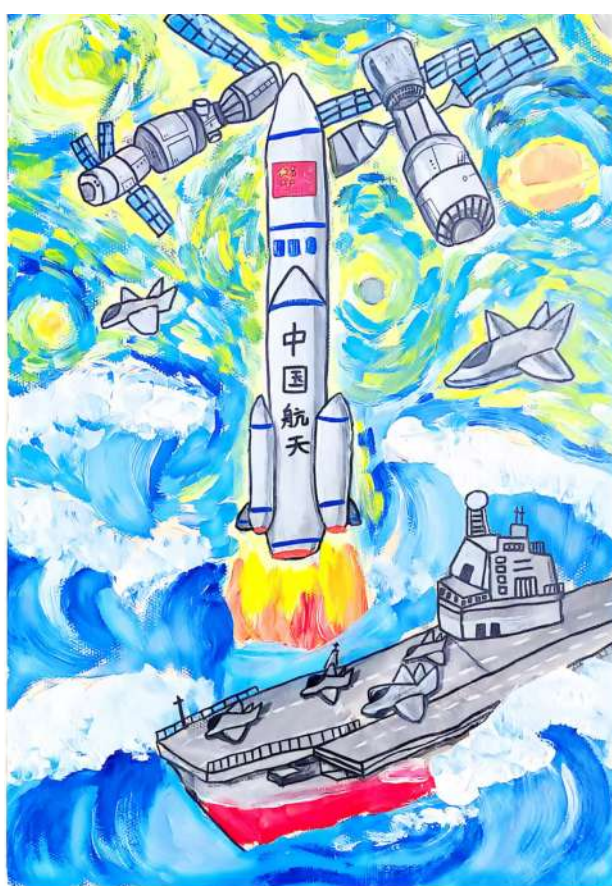
《七秩问天 逐梦苍穹》