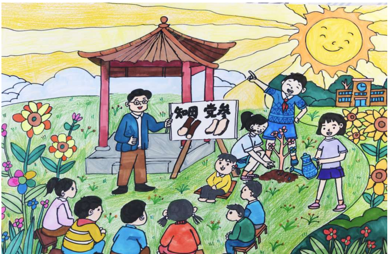
《亭下识百草,快乐小·少年》