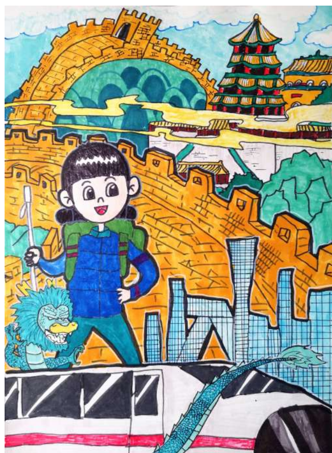
《游历祖国大好河山》