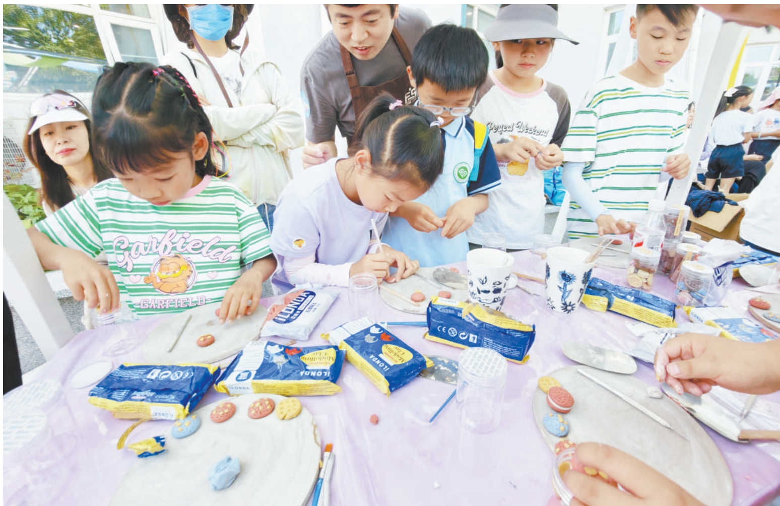
连日来,丰台区少年宫、丽泽小学、北京第五实验学校以及丰台法院等单位纷纷推出形式多样的庆“六一”活动,让孩子们在欢笑中学习、在体验中成长。(详见04版)