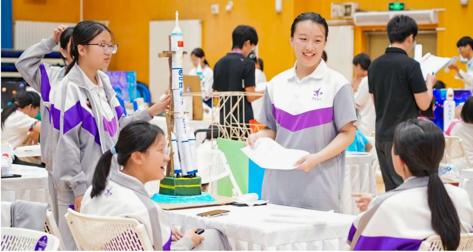
6月14日,2026年北京市中小学生航天科技体验与创意设计大赛决赛在北京钱学森中学火热举行。来自全市16个区750名学生带着319件作品齐聚一堂,竞技亮相,在航天知识比拼、思维碰撞与实践展示中,感受航天魅力、锤炼科学素养,上演了一场精彩纷呈的青少年航天科技盛宴。