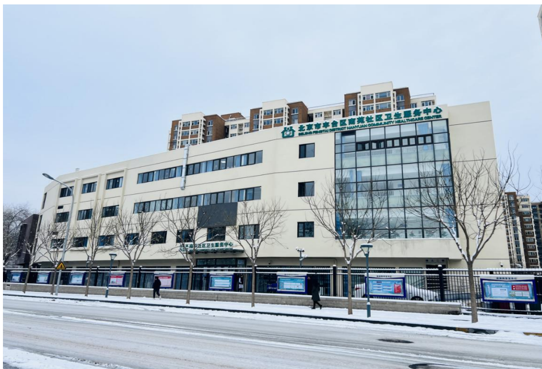
南苑社区卫生服务中心业务楼外观