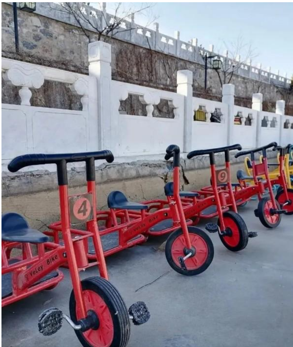
南宫冰雪奇幻小镇