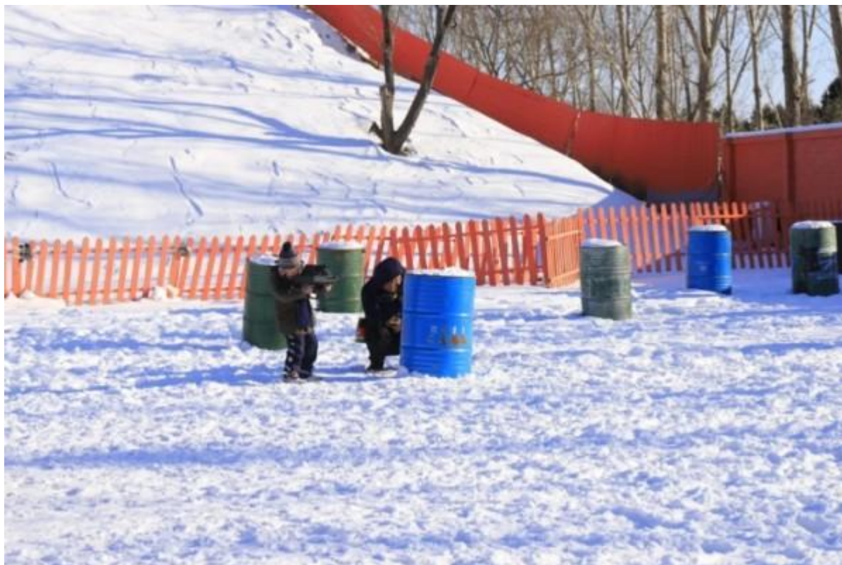
绿野仙踪郊野乐园