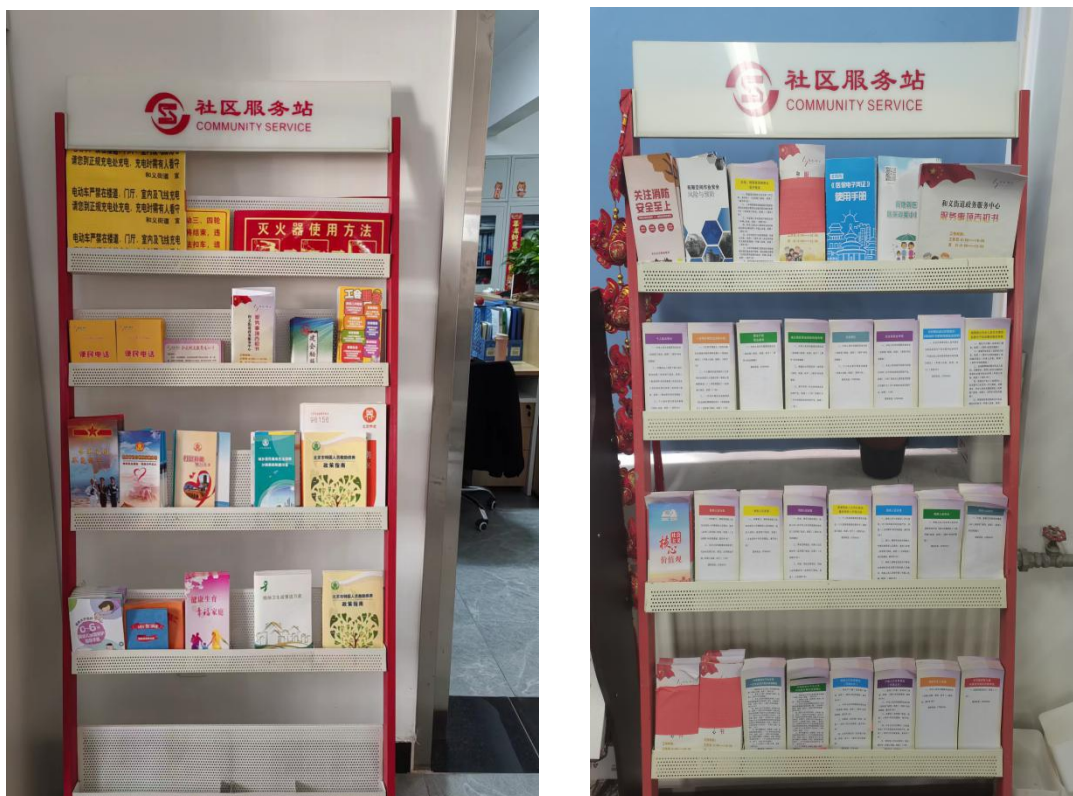
项目宣传相关照片