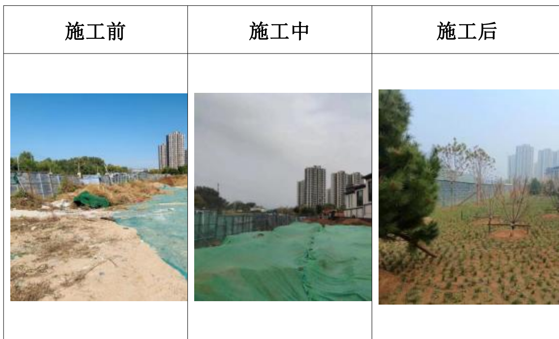
石榴庄村 S-41-1 代征绿地对比照片